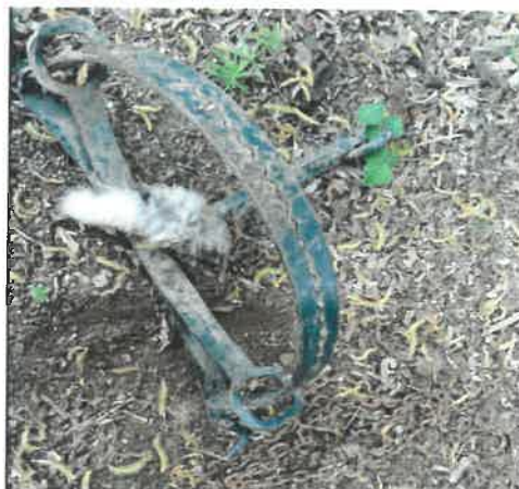
A hattyúnyak-csapda záródott állapotban.